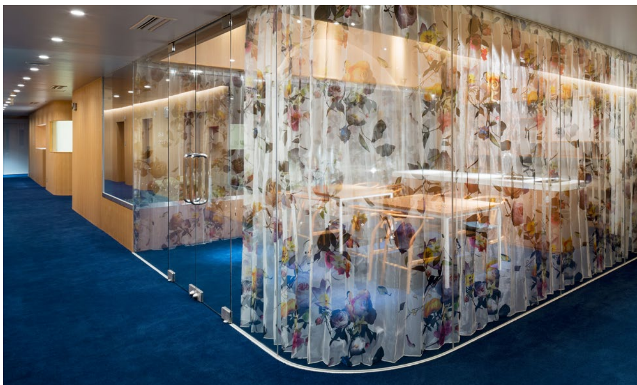
Objekt: Bara-na-izumi Women's Clinic, Matsuyama, Japan / Konzept: Junzo Kuroda, Tokyo

FREIE BAHN FÜR IHRE KREATIVITÄT: MIT UNSEREM KNOW-HOW UND UNSERER TECHNOLOGIE STELLEN WIR SICHER, DASS SO GUT WIE JEDER WUNSCH IN PRODUKTION GEHEN KANN.