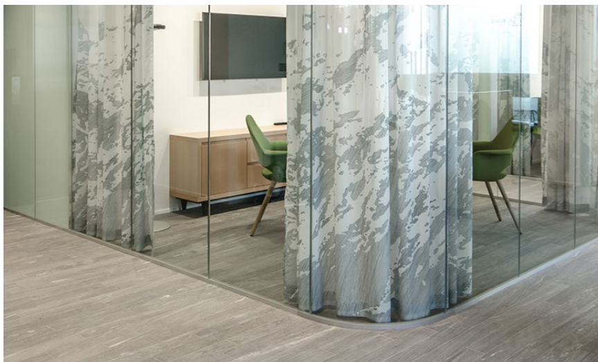
Objekt: Bank EKI, Interlaken, Schweiz Foto: Marcel Abegglen, L2A Architekten AG, Schweiz

Ob Vorhänge, Rollos, Trennwände, Akustikpaneele oder andere Bereiche der textilen Inneneinrichtung, genauso grenzenlos wie das Design der Textilien ist auch Ihre Freiheit, sie in die Raumgestaltung zu integrieren. Für Ideen und Beispiele empfehlen wir Ihnen einen Besuch auf unserer Website. Unter creationbaumann.com/referenzen finden Sie eine Vielzahl von Referenzen aus jedem Anwendungsbereich.