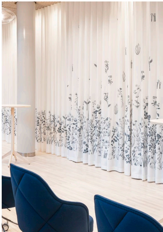
Objekt: Uppsala Stadshus, Uppsala, Schweden

FREIE BAHN FÜR IHRE KREATIVITÄT: MIT UNSEREM KNOW-HOW UND UNSERER TECHNOLOGIE STELLEN WIR SICHER, DASS SO GUT WIE JEDER WUNSCH IN PRODUKTION GEHEN KANN.