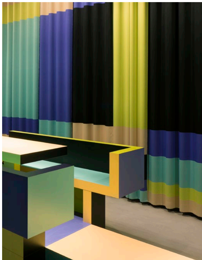
Objekt: FRAC Nord-Pas de Calais, Dunkerque, Frankreich